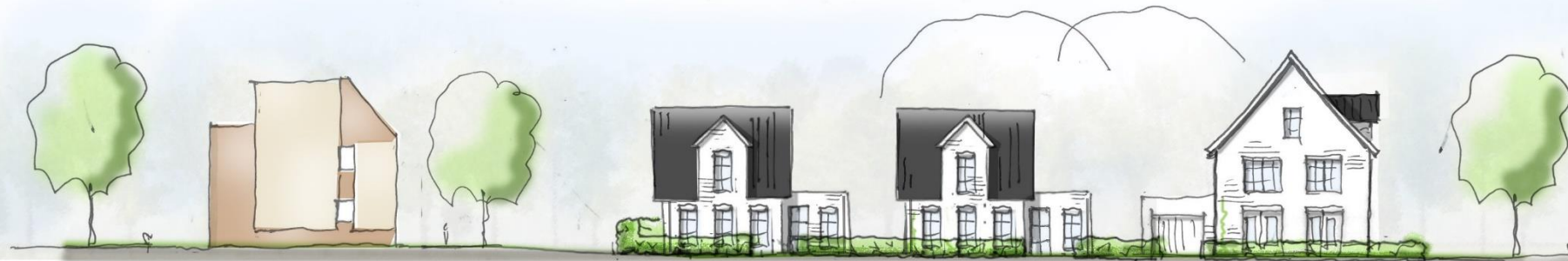
BESTANDE WONINGEN AALSCHOLVER