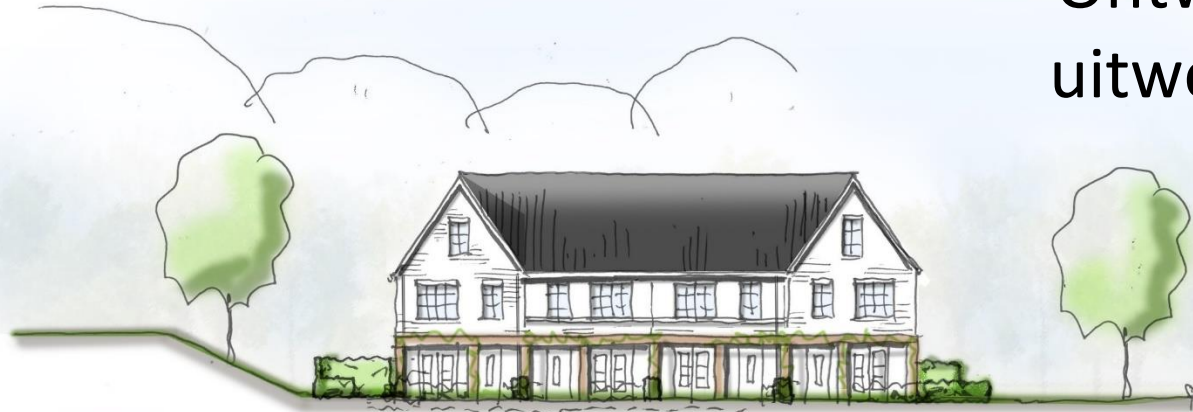
STRAAT AANZICHT LAAN VAN 'DELFLAND