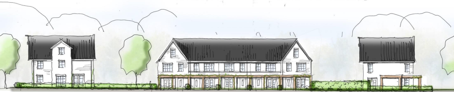
← STRAAT AANZICHT MOLENSLAG →