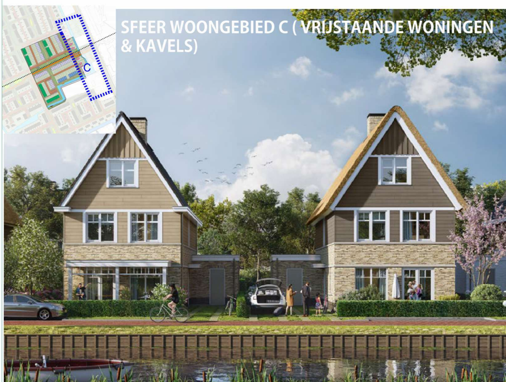
SFEER WOONGEBIED C (VRIJSTAANDE WONINGEN & KAVELS)