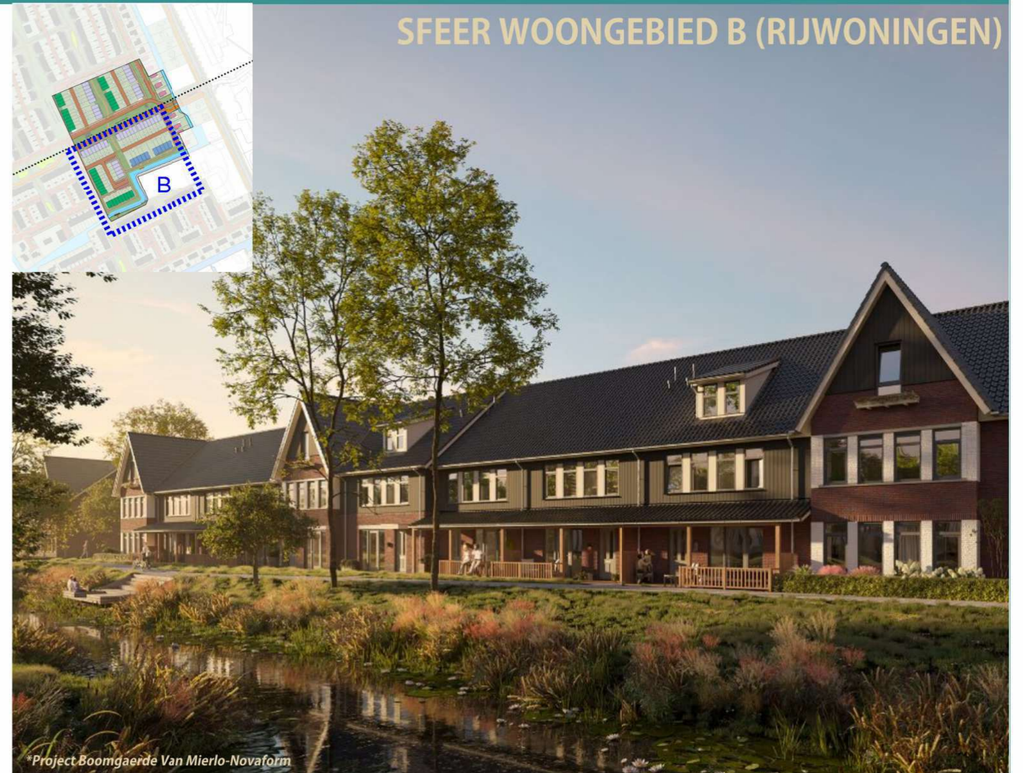
*Project Boomgaardje Van Mierlo-Novaform