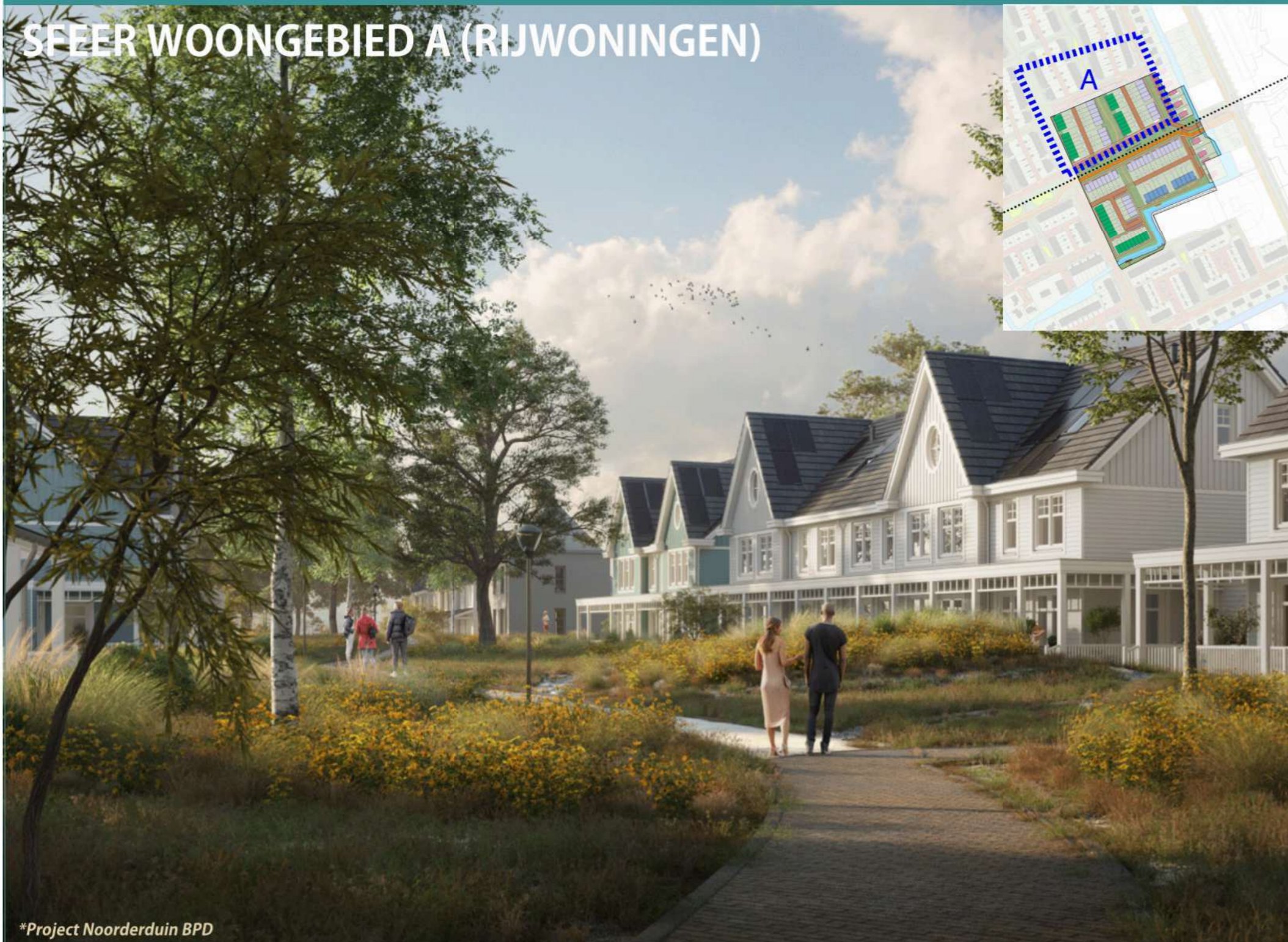
*Project Noorderduin BPD